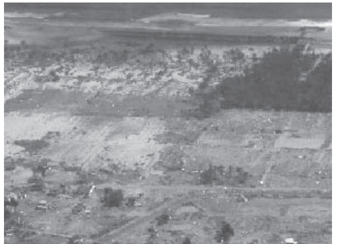
ヘリコプターから