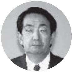
東尾張分区 瀬戸北RC