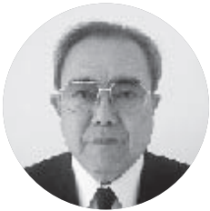
西名古屋分区 名古屋栄RC