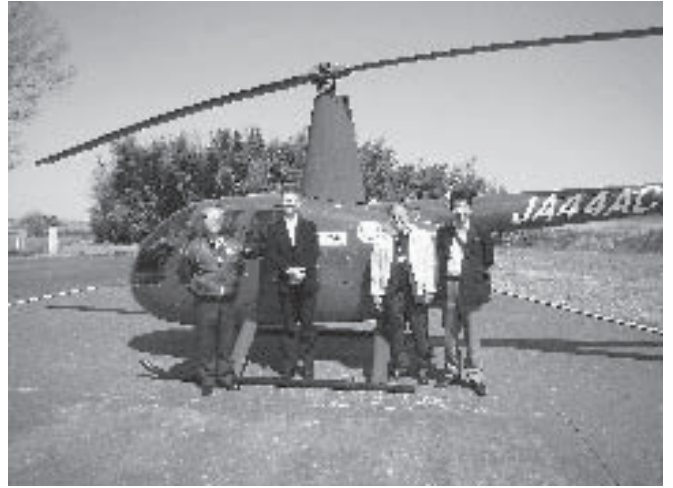
4/11現地訪問した、埼玉市民キャビネット災害支援部会長 松尾道夫さん・名古屋瑞穂RC 高須洋志さん