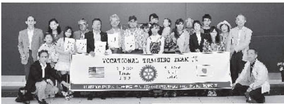
帰国出迎え記念写真（名古屋国際空港にて）