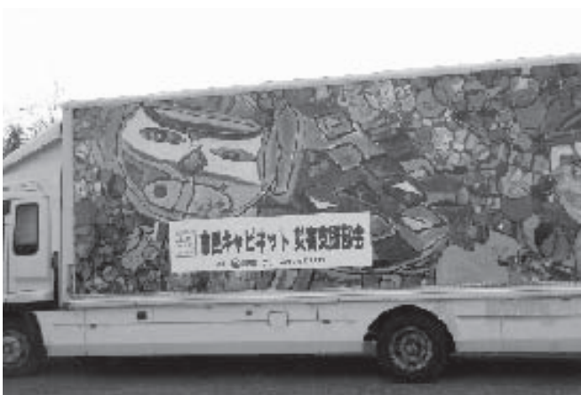
購入したトラック