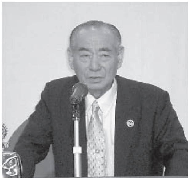
松前ガバナーエレクト乾杯のあいさつ