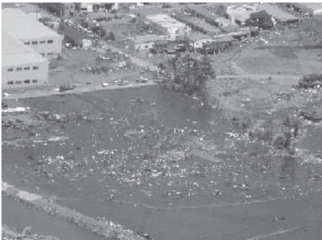
ヘリコプターから