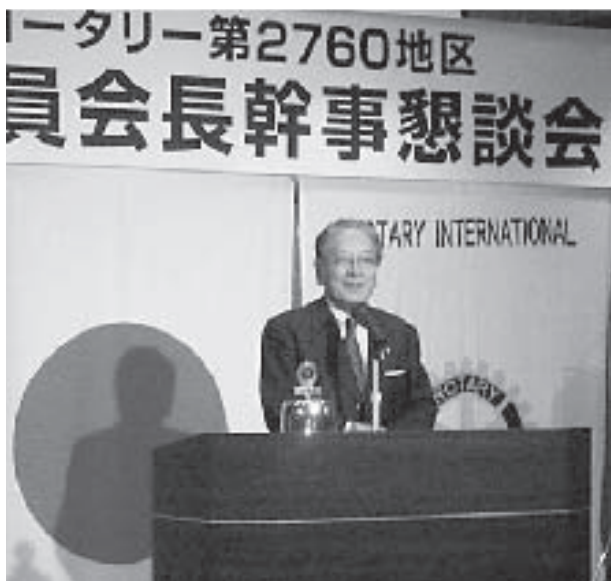
江崎柳節地区研修リーダーの閉会挨拶