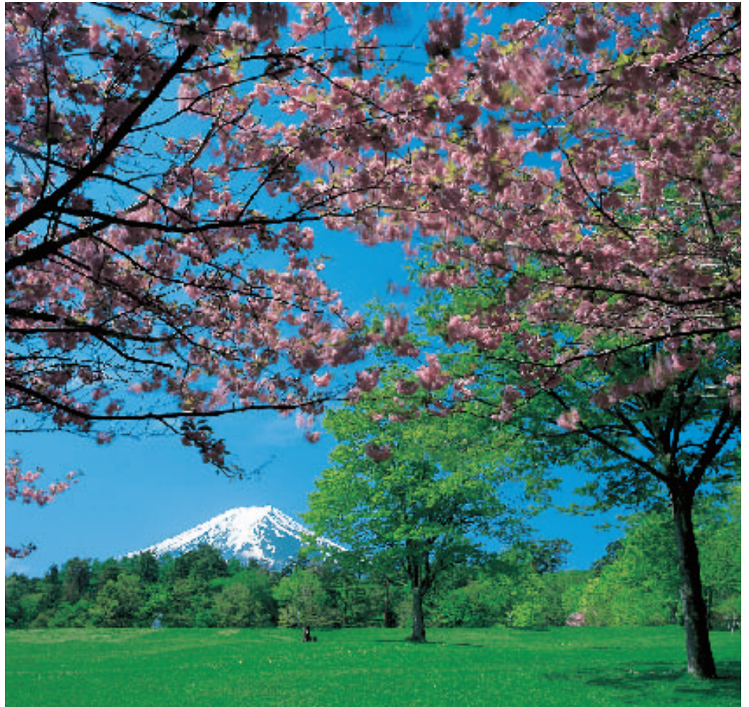
『春彩富峰』