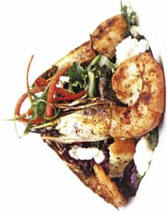
一流シェフが腕を振るケージャンとクレオール料理