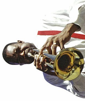
ジャズ発祥地ならではの陽気な音楽