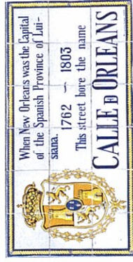
有名なフレンチクオーターを散策