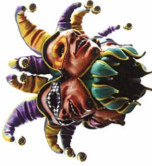
マルディグラーのお祭り気分